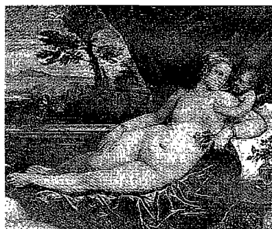
Tiziano, «Venere con cagnolino», 1560